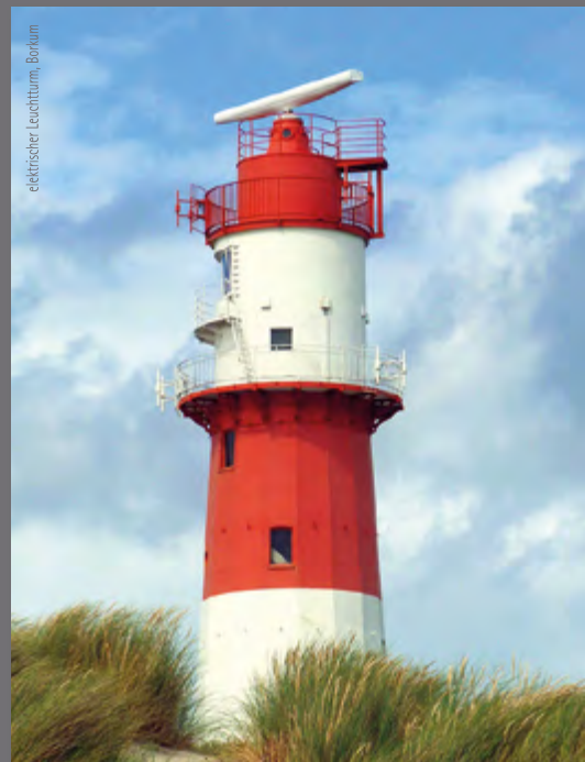
elektrischer Leuchtturm, Borkum