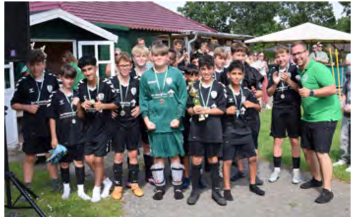
Gastgeber JSG Augustfehn/Apen belegte beim D-Juniorenturnier den dritten Platz.

Im ersten Halbfinalspiel unterlag Gastgeber JSG Augustfehn/Apen I dem JfV Westerstede knapp mit 5:6 während Post SV Oldenburg mit 2:0 gegen Schwarz-Weiß Oldenburg II gewann. Anschließend besiegte die JSG Augustfehn/Apen I im Spiel um Platz drei und vier Schwarz-Weiß Oldenburg II letztlich klar mit 4:1 Toren und machte die 1:2-Vorrundenniederlage gegen die Schwarz-Weißen wieder wett. Das Finale gewann der