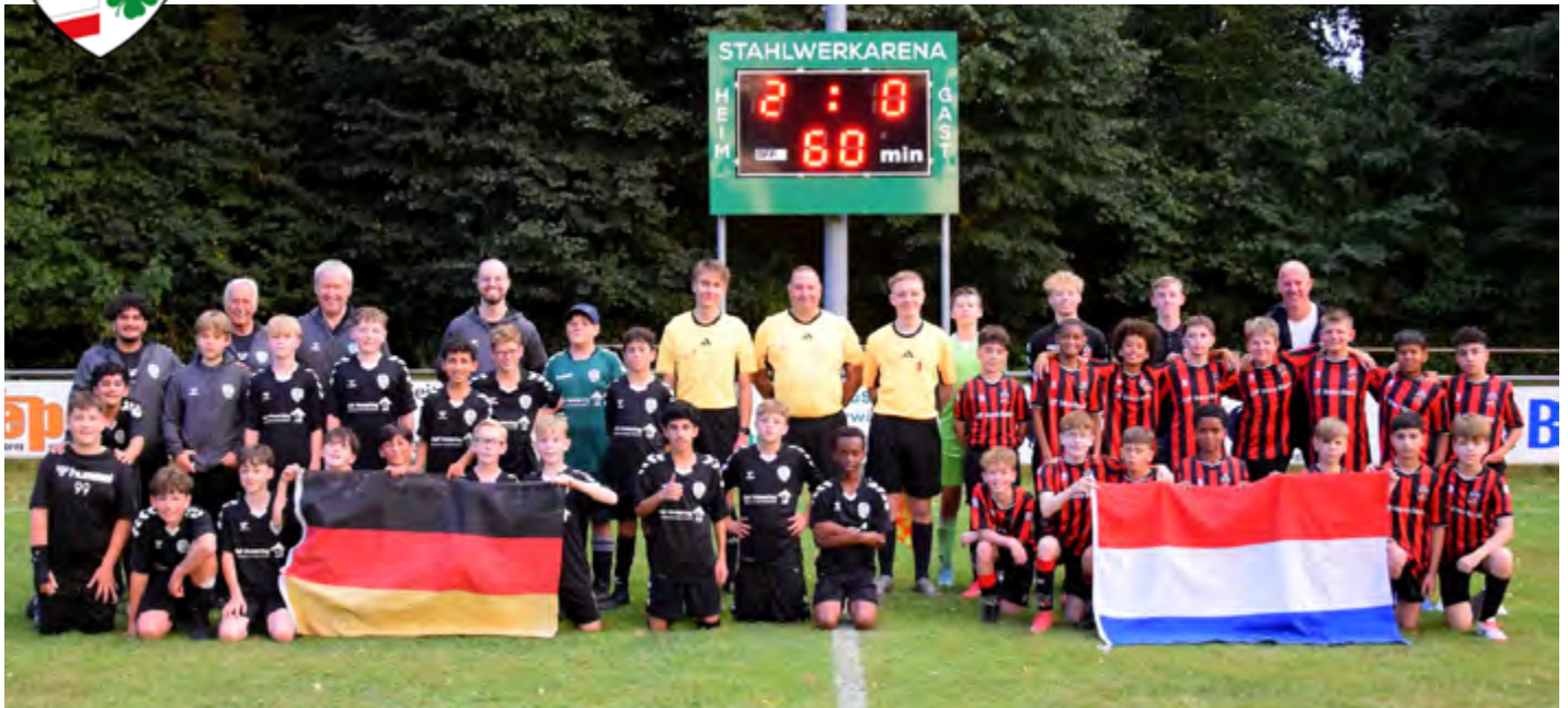
Nach Spielende kamen beide Mannschaften zu einem abschließenden Gruppenfoto vor der Anzeigetafel zusammen.

Für die D-Junioren der SG Augustfehn/Apen war es ein ganz besonderer Tag. Zum ersten Mal trat eine Mannschaft der SG in einem internationalen Vergleich an und feierte dabei vor 110 Zuschauern gleich einen gelungenen Einstand. Gegen die Niederländische Mannschaft vom WVV Winschoten siegte das Team mit 2:0 (1:0) Toren.