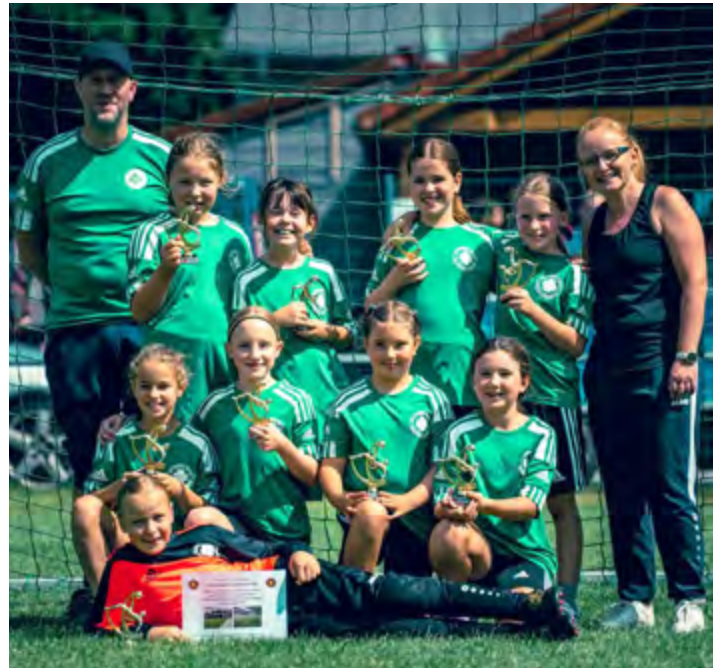
Strahlender Sonnenschein, starke Teamleistung, zweiter Platz, Pokale und als Belohnung ein Training in der Redfit Arena: Für die E-Mädels des TuS Vorwärts Augustfehn war es ein gelungenes Turnier beim SV Stern Schwerinsdorf.

Bei strahlendem Sonnenschein traten die E-Mädchen des TuS Vorwärts Augustfehn beim Turnier des SV Stern Schwerinsdorf an – und zeigten eine großartige Leistung.