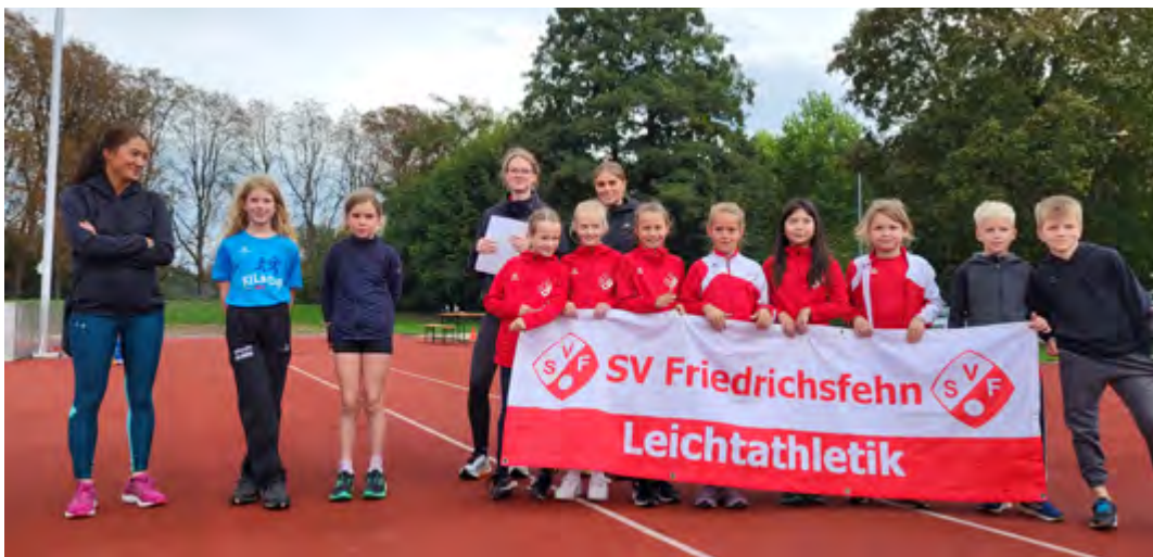
Die U10-Mannschaft des SV Friedrichsfehn