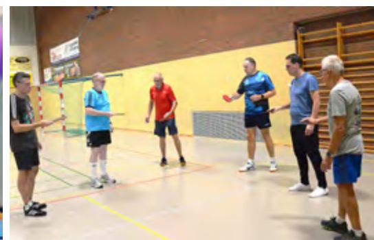
Tischtennis Ballgefühl üben