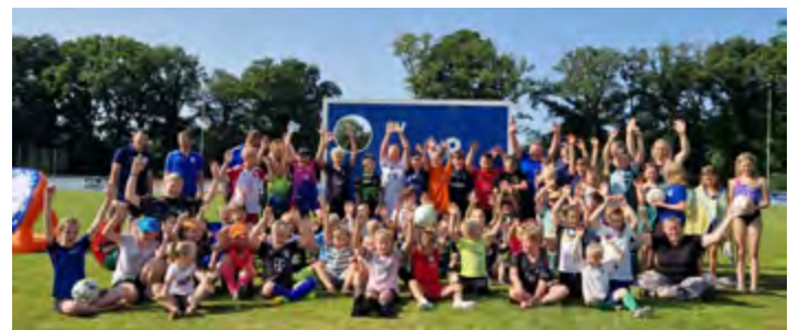
Ferienpass-Aktion beim Förderverein Jugend-Sport SV GOTANO

Jedes Jahr im August veranstaltet der Förderverein Jugendsport SV GOTANO eine Ferienpass-Aktion im Sportpark GOTANO, zu der alle Kinder über den Ferienpass der Gemeinde Apen eingeladen werden.