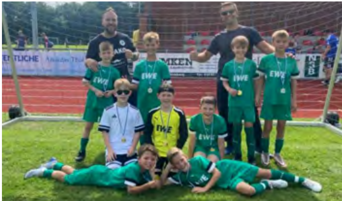
Die E1-Junioren des TuS Vorwärts Augustfehn erreichten einen starken dritten Platz beim BWR-Cup in Ramsloh.

Der neue Jahrgang der E1-Junioren des TuS Vorwärts Augustfehn startete mit zwei starken Auftritten in die Vorbereitung zur Saison 2025/26. Sowohl beim BWR-Cup in Ramsloh als auch bei den vereinseigenen Sporttagen in der Stahlwerk-Arena zeigten die Jungs, dass sie schon früh in Form sind.