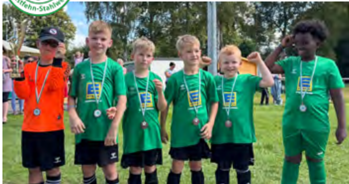
Einen guten dritten Platz belegte das Team vom TuS Vorwärts Augustfehn I beim F-Juniorenturnier.

Sehr viele Treffer erzielten die F-Junioren bei den Fußballtagen des TuS Vorwärts Augustfehn. In 21 Turnierbegegnungen (3+1) trafen die sieben teilnehmenden Mannschaften insgesamt 153 mal ins gegnerische Tor. Das waren mehr als sieben Tore pro Spiel in der jeweils zehnminütigen Spielzeit. Ungeschlagen errangen die Jungs vom FSV Westerstede II den Turniersieg.