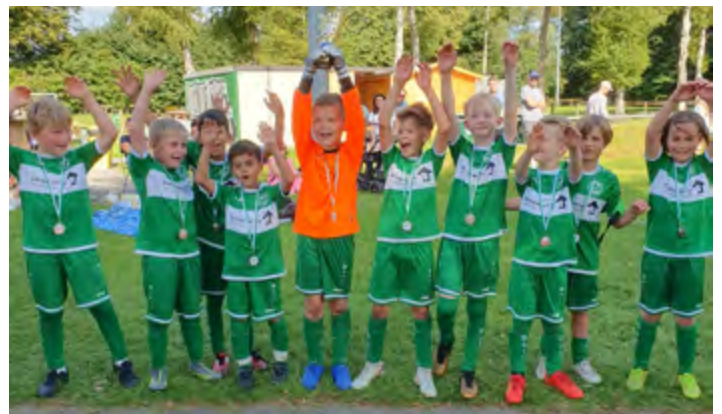
Die Spieler der Mannschaft vom TuS Vorwärts Augustfehn I jubelten bei der Siegerehrung über den dritten Platz beim E-Juniorenturnier.

Fünf Mannschaften gingen beim Turnier der E-Junioren im Rahmen der Sporttage des TuS Vorwärts Augustfehn an den Start. Nach zehn Begegnungen und 50 geschossenen Toren stand mit dem VfL Oldenburg III der Turniersieger fest. Und das aufgrund des besseren Torverhältnisses punktgleich mit der SG Fri/Pe I und den Gastgebern vom TuS Vorwärts Augustfehn I.