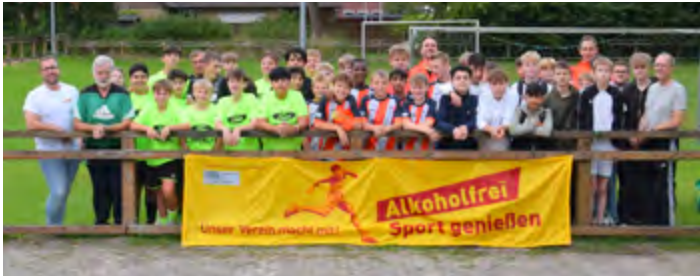
Gemeinsames Abschlussfoto der C-Junioren-Mannschaften vor dem Banner „Alkoholfrei Sport genießen“.

In der letzten Sommerferienwoche war wieder viel los in der Stahlwerk-Arena. Anlässlich der Fußballtage des TuS Vorwärts Augustfehn fanden bei bestem Fußballwetter an drei Tagen vier Jugendturniere der jüngeren Mannschaften statt.