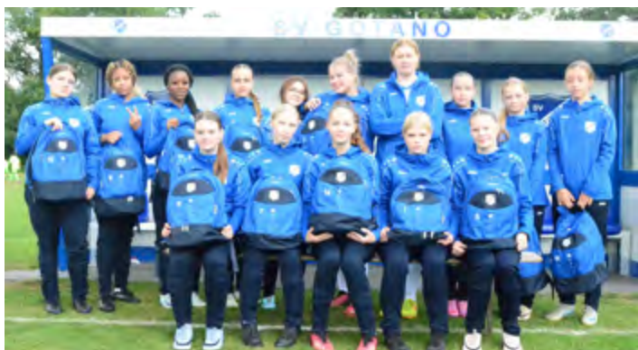
Vom Förderverein gab es Rucksäcke