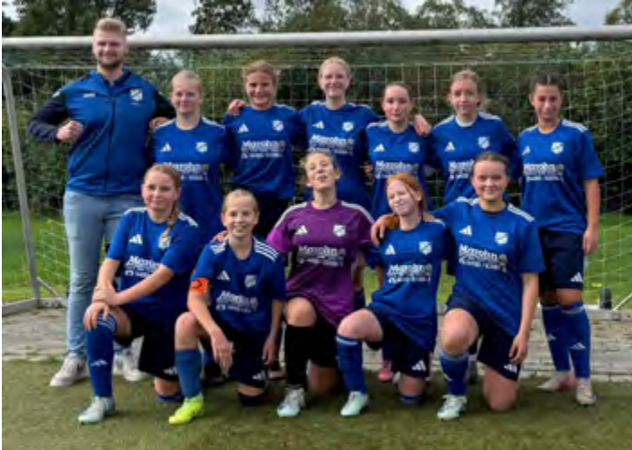
Ungeschlagen Herbstmeister C-Mädchen SV GOTANO