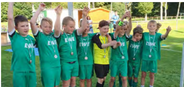
Bei den Sporttagen in der Stahlwerk-Arena belegten die E1-Junioren den dritten Platz, punktgleich mit dem Turniersieger und dem Zweitplatzierten des Turniers.

Zwei Turniere, zweimal auf dem Treppchen – und das schon in der Vorbereitung. Die E1 zeigte, dass sie spielerisch und kämpferisch auf einem guten Weg sind. Die kommenden Wochen werden genutzt, um weiter an der Abstimmung und Fitness zu arbeiten. Alle freuen sich auf eine spannende Saison 2025/26 mit den E1-Junioren des TuS Vorwärts Augustfehn. Daniel Ottjes