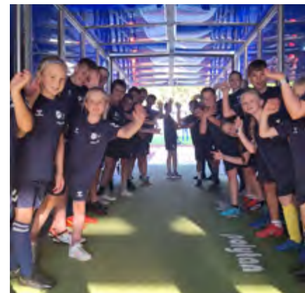
Ein Blick in den Spieler Tunnel