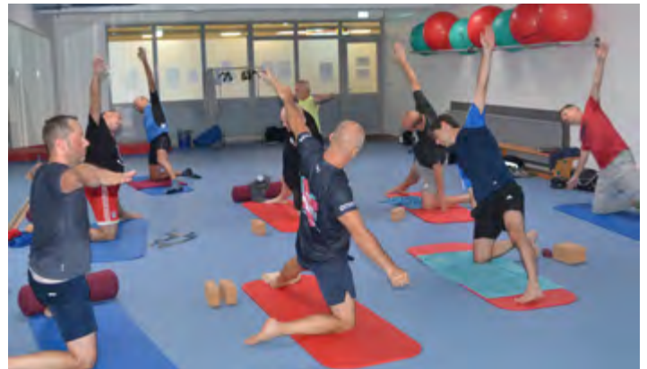
Yoga - auch wenn es knackt im Gebälk